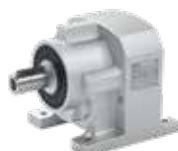
Carter avec arbre de sortie