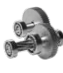
Kits de rapport de réduction